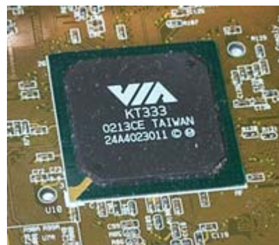
Figure 2 – Les tampons ne doivent pas être installés